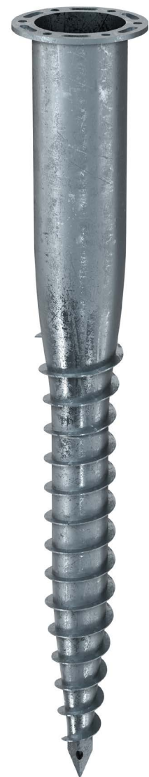
KSF F 140x1600-P