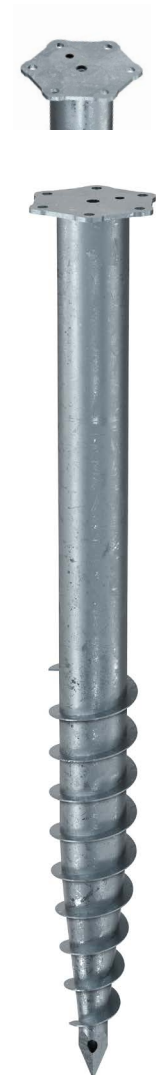
KSF M 76x800-M12