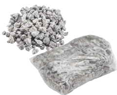
Speciaal granietsplit 1,50 kg Art.nr. 21824