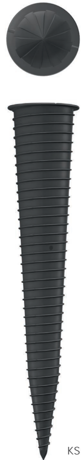
KSF K 34 x 550